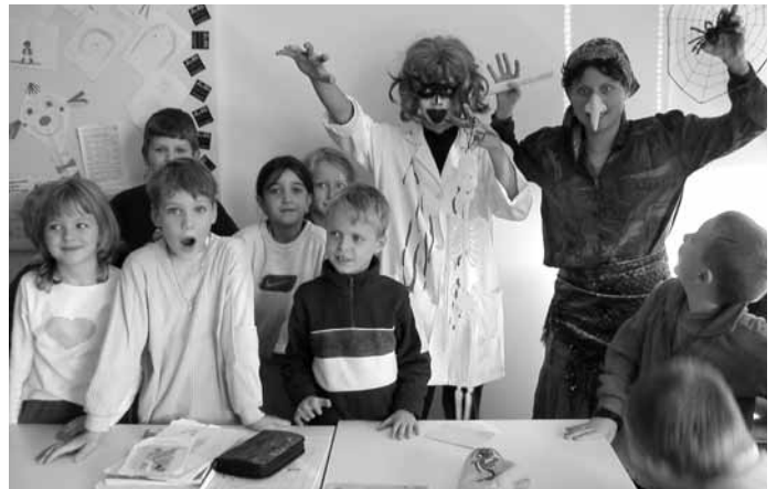
Aj keď sa strašidlá občas snažili, pôsobili dosť umiernené a medzi deťmi boli veľmi populárne.

(s) Ani sa nám to nechce veriť, ale je to tak! Už po šiestykrát sme sa v E - KU pokúsili navodiť atmosféru sviatku všetkých duchov a čarodějnic Halloween, ktorý už oslavovali starí Kelti. Oslavuje sa 31. októbra a uznávajú ho predovšetkým v anglicky hovoriacich krajinách. Avšak v poslednej dobe prenikol aj do Európy. Pretože náš inštitút má v názve slovo „interkultúrny“, snažíme sa aj takýmto spôsobom integrovať spoznávanie iných kultúr. A tak na dva dni k nám zamierili celkom dobrosrdečné strašidlá - akási prapodivná bosorka v sprievode skrveného upíra. Prečo dobrosrdečné? Pretože v každej triede rozdávali sladkosti. Tak ktože by sa ich už potom bál?!