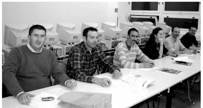
Kurz slovenčiny pre cudzincov v tomto čase navštevujú Nemci, Kubánci, Taliani a Španieli. V tých predchádzajúcich sa vystriedali okrem uvedeních národností aj Rakúšania, Angličania, Američania, Malajzijčanka a misijné sestry z Tichomoria.

Riaditeľstvo E - KU Inštitútu jazykovej a interkultúrnej komunikácie vypisuje konkurz na miesto