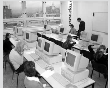
Na snímke sú uchádzači o Európsky vodičský preukaz na počítače v našom Akreditovanom testovacom centre. Je to medzinárodný doklad, ktorý je uznávaný aj v krajinách EÚ.

Skúšky je nutné vykonať v priebehu 3 rokov od dátumu registrácie. Skúšky vykonávajú len akreditované testovacie centrá.