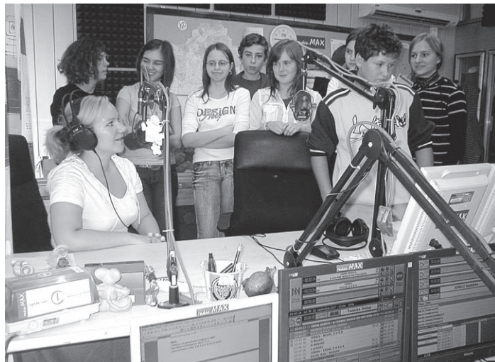
Aj portály Európskej únie zaznamenali aktivity E – KU. Naši teenageri v živom vysielaní Rádia MAX.

Oprávnenie na vykonávanie štátnych jazykových skúšok, ktoré získali niektoré vysoké školy v minulosti, stratilo platnosť. Presne sformulované znenie je uverejnené na str. 43 v Pedagogicko - organizačných pokynoch MŠ SR na školský rok 2007/08. Akékoľvek získanie štátneho vysvedčenia o vykonaní základnej, všeobecnej alebo inej štátnej jazykovej skúšky je v súčasnosti protizákonné a neplatné.