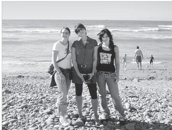
Vody Atlantiku sú skvelé.