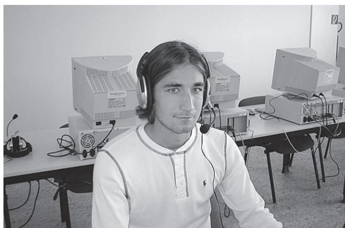
Prvý účastník americkej skúšky TOEFL k nám prišiel z Topolčian.

Sledujte s nami v každom čísle foto reportáž z hodín angličtiny pre našich najmenších (viď. s. 4). Štvorročné detičky si osvojujú cudzí jazyk podľa zásady: Jedna osoba – jedna reč! Deti sa učia výlučne hrou a napodobňovaním. Aj „uši“ detí sú v tomto veku mimoriadne citlivé, preto cudzojazyčná výslovnosť nie je pre ne problémom.