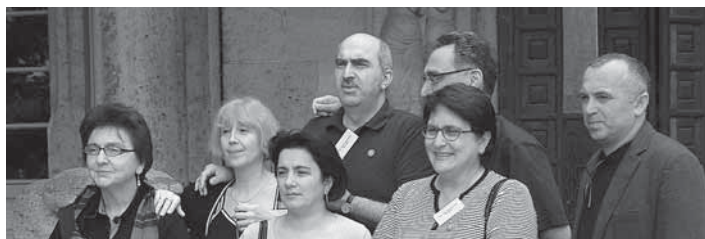
Spomienka na Gruzíncov. Univerzitné oslavy v Jene, jún 2008.

to, že ho ovplyvní nová Vyhláška o jazykových školách, ktorá práve vstúpila do platnosti. Sú v nej síce aj nové pozitívne prvky, ale predovšetkým na niekoľko rokov dopredu zakonzervovala staré problémy. Nebudem vás zaťažovať odbornou problematikou o štandardizácii, validite a reliabilite jazykových skúšok, ktorých sa vyhláška takisto dotýka. Návrh vyhlášky sme pripomienkovali, ale už to nikoho nezaujímalo. Prečo k návrhu vyhlášky neprebehla odborná celoslovenská diskusia? To naozaj nikoho netrápi? Viem, otázky sú čisto rečnícke a prepadajú sa do prázdna nezaujmu štátnych úradníkov MŠ SR.