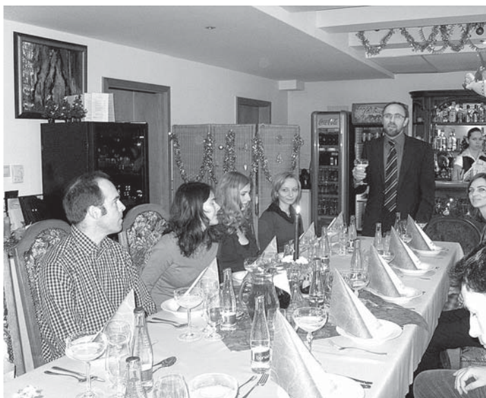
Pracovníci E - KU v predvianočnej atmosfére.