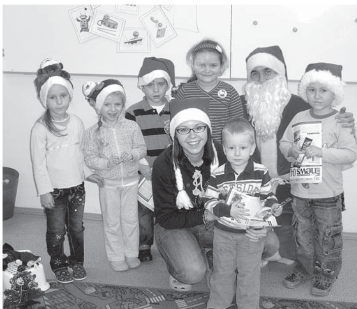
Najmladší angličtinári sa v decembri potešili Santa Clausovi.