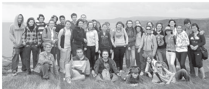
Na snímke sú účastníci jazykového pobytu, ktorí navštívili Anglicko v auguste 2008.

Koncom januára finišovali posledné prípravy na jazykovo – poznávacom pobyte, ktorý sa bude konať v Anglicku od 22. 7. do 31. 7. 2009. Žiaci a študenti E - KU majú možnosť navštíviť oblasť Severného Devonu. Účastníci pobytu budú ubytovaní v anglických rodinách. Dopoludnia sú venované jazykovým kurzom, ktoré vedú anglickí lektori. Popoludnia patria spoznávacjej časti, pretože účastníci absolvujú výlety a navštívia rôzne pamätihodnosti. Cestou naspäť nebude chýbať ani zastávka v Londýne s návštevou slávnych pamiatok a miest, ako sú napr. St. Paul's Cathedral, Tower Bridge, Trafalgar Square a pod. Žiakom a študentom budú k dispozícii aj pedagógovia E – KU, ktorí ich budú počas pobytu sprevádzať. Presný program s cenou a všetkými potrebnými detailami bude uverejnený vo februári na internetovej stránke www.eku.sk a v ďalšom čísle našich novín.