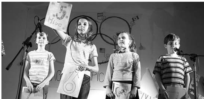
Záber je z detskej akadémie. Pretože sme venovali veľa energie na organizáciu jazykového kurzu vo V. Británii, rozhodli sme sa, že akadémia sa v tomto roku konať nebude. To ale nemení nič na tom, že riaditeľ E – KU vyhlási a odmení najlepších žiakov a Skokana roka za tento šk. rok.

V oznámení vyučujúci vyhodnotí výsledky testov, prípravu na hodiny, dochádzku a v prípade potreby uvedie konkrétne pripomienky k práci žiaka.