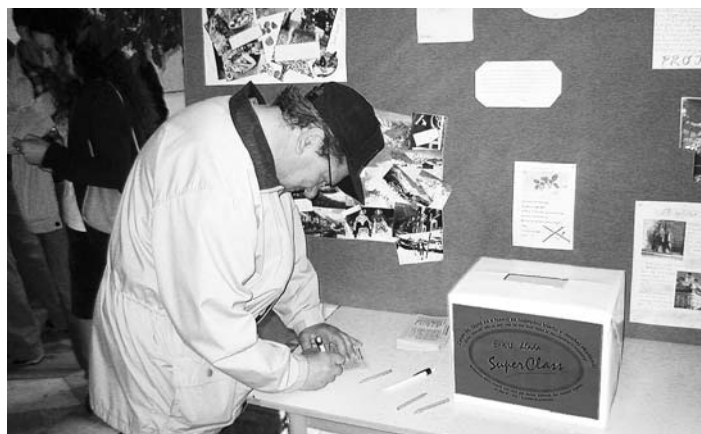
S rodičmi máme dobrú spoluprácu. Ak pripravíme podujatie, radi nás a svoje ratolesti povzbudia. Platí to aj pre mnohých starých rodičov.

Do 18. 3. 2009 sa treba zaregistrovať a uhradiť príslušný poplatok za vykonanie štátnych jazykových skúšok v letnom termíne. Súčasne E – KU Inštitút Jalk opakovane upozorňuje, že vykonávanie štátnych jazykových skúšok na univerzitách podľa vyhlášky pre jazykové školy je protizákonné! Týka sa to predovšetkým študentov nefilologických odborov. (Viac o termínoch: 1. s., Marcový E – KU TIP.)