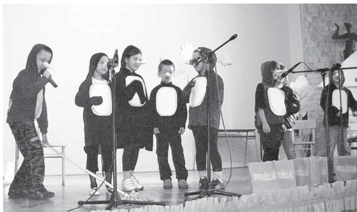
Srdcia divákov si získali usilovní tučnákovia, ktorí prišli na pódium s číslom Look at Me – I'm Cleaning the Floor.