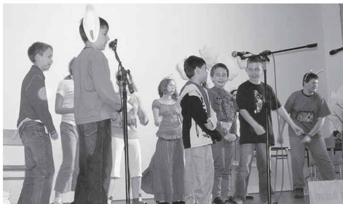
Na číse All Star sa podieľali žiaci z dE – 3.K a dE – 4.D.