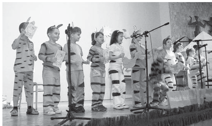
Krásne kostýmovaní „nulkári“ sa blykli nielen oblečením, ale aj výborným vystúpením Let's All Look for Densel, za čo získali aj 1. miesto spomedzi všetkých účinkujúcich.