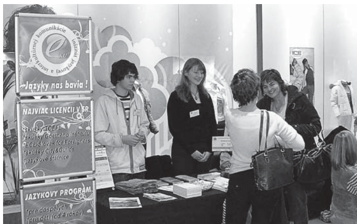
Snímka zachytáva prezentáciu E - KU v nitrianskom nákupno-obchodnom stredisku CENTRO, ktorá sa konala v predvianočnej atmosfére 8. decembra 2007.