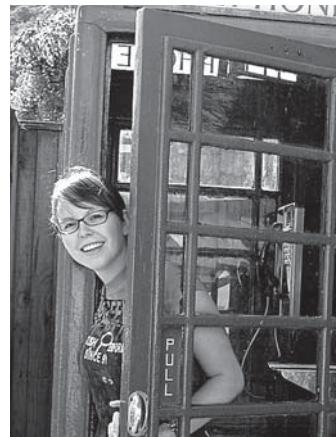
... a do toho Anglicka pôjdem s vami aj ja!

(mv) Po minuloročnom úspešnom jazykovo-poznávacom pobyte v Anglicku sa pripravuje ďalší pobyt pre žiakov a študentov E - KU počas letných prázdnin v mesiaci august 2008. V marci budú uverejnené bližšie informácie v novinách a na internete. Na internetovej stránke www.eku.sk , v sekcii fotogaléria, si môžete pozrieť fotografie z leta 2007. ←