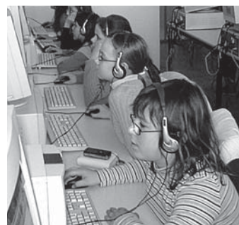
Aj takto môže vyzerat hodina angličtiny.

jaký predmet a potom ho treba nájsť. Možno ste ani netušili, ako sa takto dajú efektívne precvičiť anglické predložky! Pošlite teda dieťa za dvere a niečo schovajte. Atmosféru hľadania komentujte po anglicky: „Hot, cold...“ Jazykovo zdatnejší rodičia dokážu situáciu určite gradovať: „Hot, very hot... Cold, bríííí!“ Keď dieťa hľadaný predmet nájde, povedzme pero v školskej taške, musí povedať, kde ho našlo: „The pen is in the school bag.“ Všetky ste si s deťmi výborne precvičili predložky, napr. in, on, under, behind, next to?“