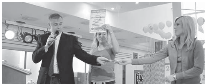
V apríli sme venovali cenu do akcie pri príležitosti 2. narodenín nákupného strediska CENTRO Nitra. Hosteska (uprostred) drží v rukách našu darčekovú poukážku.