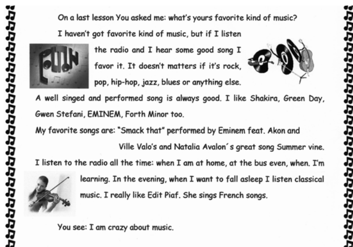
Našu vyučujúcu potešila pekná práca od žiačky Szimonky Szórádovej zo skupiny dE - 6.K. Vtedy je to obojstranne radostný pocit. Veľa úspechov v angličtine, Szimonka!