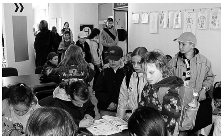
Už 15 rokov sa intenzívne venujeme aj výučbe detí. Veľa z nich sa prehuplo do „dospeláckeho“ veku a vodia k nám už ďalšiu generáciu vlastných detí. Snímka je typickým obrázkom atmosféry v E - KU, aká vládne pred začiatkom vyučovania.

Mali by byť jednoznačne reálne. Privysoké očakávania môžu priniesť sklamanie. Môžete namietat, čo to je - reálne? Existujú tabuľky, ktoré odporúčajú > pokračovanie na 4. strane