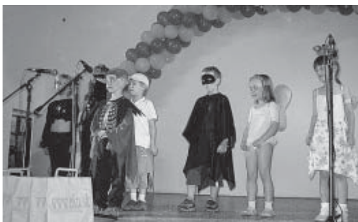
Naši najmladší angličtinári zo skupiny dE -0 sa „potrápili“, pretože vo svojej scénke Where's my ball? hľadali loptu. Okrem toho boli milí a mali aj pekné kostýmy