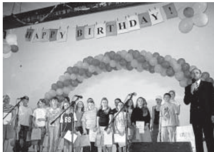
Pohľad na časť vyznamenaných žiakov, ktorí budú raz určite úspešní.