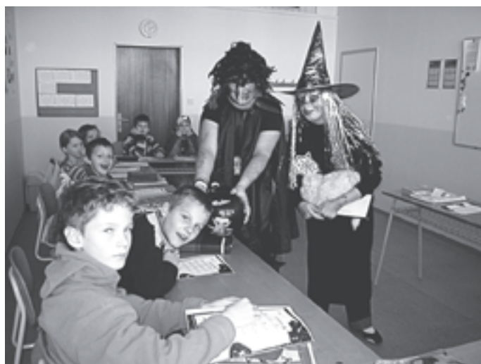
Strašidlá v akcii.