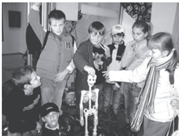
Halloweenska atmosféra má zvláštne kúzlo.

V dňoch 30. 10. a 31. 10. 2006 sa konal v E – KU Inštitúte VIII. ročník Halloweenu. Žiaci si takto pripomenuli starý keltský sviatok, počas ktorého ožívajú duchovia a čarodejnice. Napriek strašidelnému základu tohto sviatku je sprevádzaný humorom, zábavou a špecifickou atmosférou.