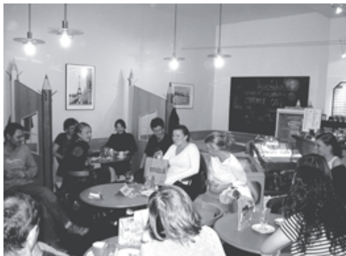
Záber dokumentuje prvú "Kaviareň", ktorá sa niesla v americkom duchu.