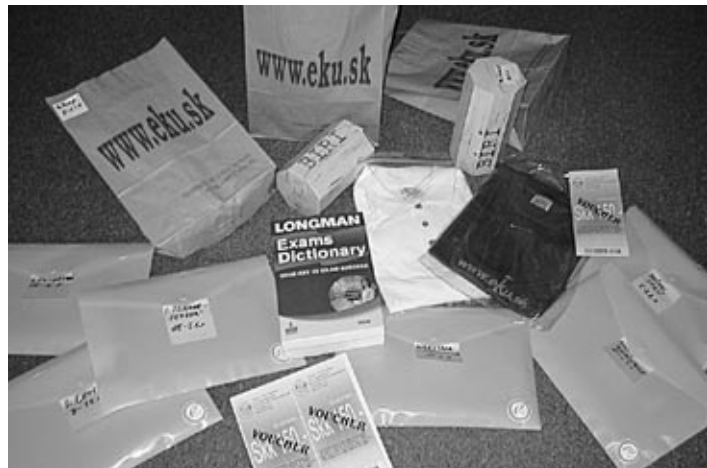
Prípravené ceny pre našich víťazov: kvalitné slovníky, knihy, prezentačné predmety E - KU (tričká, vazy...), ale aj poukážky určené na dobroty v našej kaviarni CAFFINET.

(mv) V rámci osláv Európskeho dňa jazykov vyhlásil E - KU Inštitút už po tretíkrát jazykovú súťaž Slovo roka 2006 s termínom uzávierky 12. 10. 2006. Súťaže sa zúčastnil rekordný počet žiakov a študentov, a to celkovo 435 súťažiacich. (Piaty súťažiaci boli vyradení kvôli nevyplneným identifikačným údajom.) Cieľom nezvyčajného súťažného zápolenia je rozvíjať netradičné postupy v jazykovej výučbe, ako aj podporiť záujem o štúdium cudzích jazykov. Súťaž nepochybne pomáha budovať u žiakov a študentov emocionálne kladný vzťah k osvojovaniu si cudzieho jazyka.