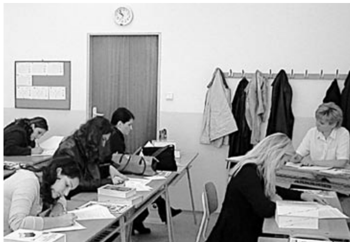
Dňa 27. 10. 2006 sa konala písomná časť štátnych jazykových skúšok z AJ a NJ pre 50 účastníkov. Len tí, ktorí boli úspešní, budú v novembri pripustení k ústnej časti.

Kurzy sú zamerané na zvládnutie jednotlivých modulov v rámci programu ECDL . Cena a rozvrh – dohodou. Kurzy vedú skúsení lektori. Prvé Akreditované testovacie centrum ECDL v Nitre vzniklo práve v E - KU Inštitúte.